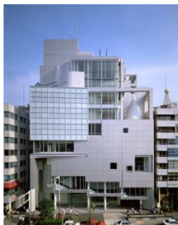
Derecha: Spiral.