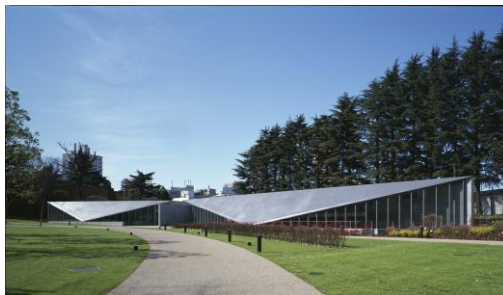
Izquierda: Foto de Tadao Ando Architect & Associate Derecha: 21_21 DESIGN SIGHT. Foto de Mitsuo Matsuoka