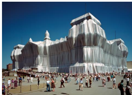
Izquierda: Christo y Jeanne-Claude en “The Gates”, febrero de 2005 Derecha: Wrapped Reichstag, Berlín, 1971-95