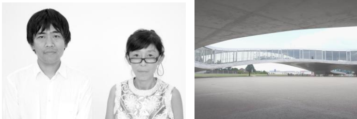
Izquierda: Foto de Takashi Okamoto. Derecha: Centro de Aprendizaje Rolex. Foto de SANAA

Entre sus obras más importantes destacan el Museo de Arte Contemporáneo del Siglo XXI en Kanazawa (Ishikawa, Japón), el Pabellón de Cristal del Museo de Arte de Toledo (EE.UU.), el Nuevo Museo de Arte Contemporáneo (EE.UU.) y el Centro de Aprendizaje Rolex, EPFL – Escuela Politécnica Federal de Lausana (Suiza). Recibieron de forma conjunta el León de Oro en la 9ª Bienal de Arquitectura de Venecia, en el 2004, y el Premio Pritzker de Arquitectura, en el 2010.