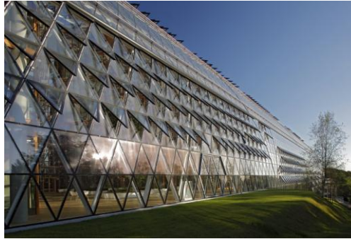
Izquierda: Foto de H.G. Esch. Derecha: European Investment Bank. Foto de Andreas Keller