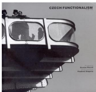
Derecha: “ Czech Functionalism 1918 /1938 ” (AA Londres).