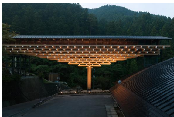
Izquierda: Foto de Kengo Kuma y asociados Derecha: Museo Puente de Madera de Yushara. Foto de Takumi Ota